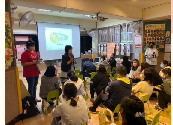
幼小銜接親子講座