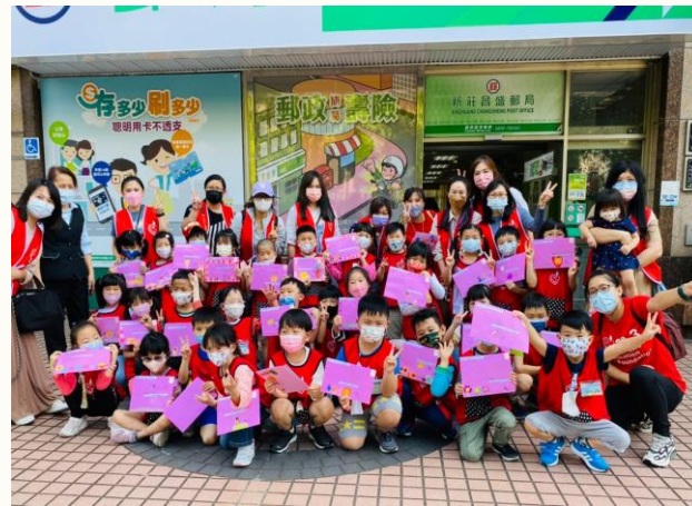
昌盛郵局-郵你真好