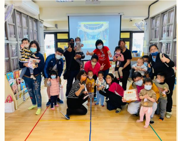
昌平幼托銜接親子活動